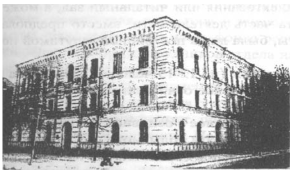
Здание Научной библиотеки ТвГУ с 1919 по 1995 г. (до 1917 г. - школа Максимовича)

После создания университета для библиотеки начались годы стремительного развития. Таких темпов роста библиотека не знала ни в один из предшествующих периодов. Сопоставление и анализ количественных показателей и содержания работы отчетливо показывают, что, несмотря на скверную материальную базу, больше всего