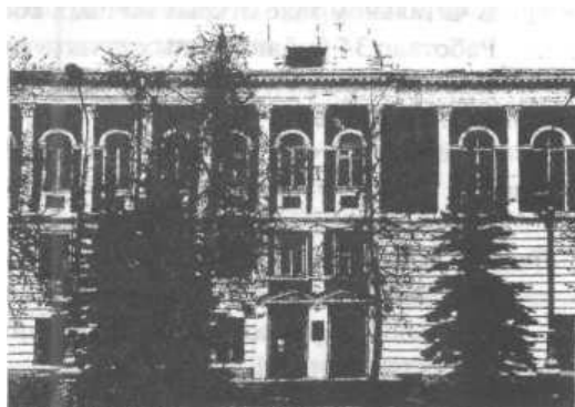
Здание Научной библиотеки ТвГУ (до 1990 г. — Дом политического просвещения)