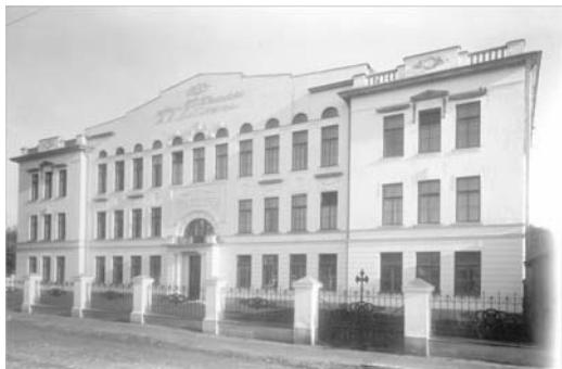
Главное здание ТвГУ (ректорат) (до 1917 г. – школа Максимовича)

Второго ноября 1917 г. в Твери состоялось официальное открытие учительского института. За время своего существования институт, а вместе с ним и библиотека, пережили много изменений и реорганизаций. Самыми трудными были первые годы – годы становления. Институт не раз находился на грани ликвидации, но выжил, выстоял и в страшные 30-е, и в пору военного лихолетья и послевоенной разрухи.