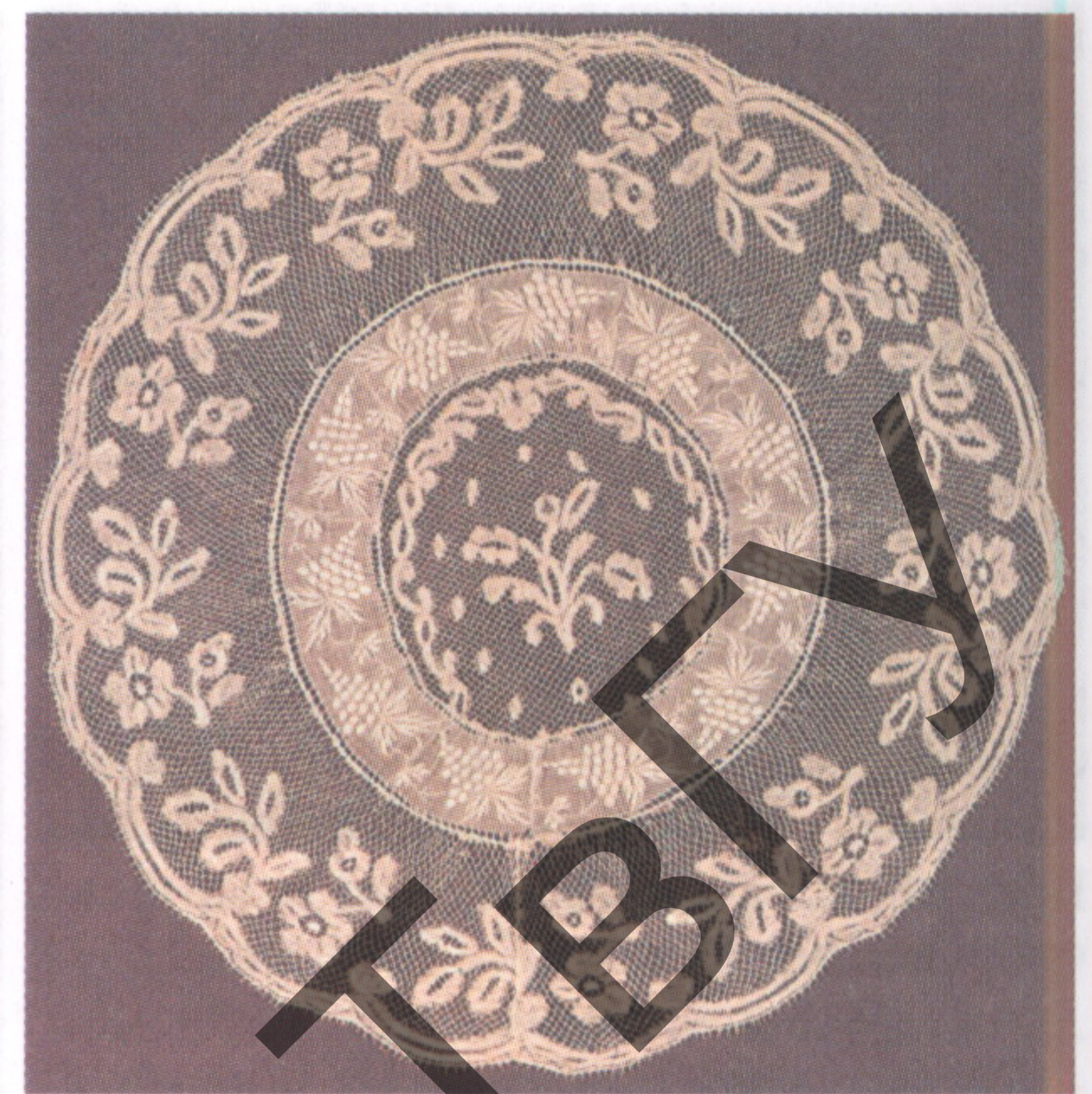
Елецкое кружево. Салветка. Кон. 19 — нач. 20 вв.

ЕЛÉЦКОЕ КРУЖЕВО — один из видов русского плетения кружев на коклюшках. Как промысел сложился в нач. 19 в. в г. Елец. Стиль и технические приёмы Е.к. заключаются в переходе полотнянки, изменчивой по плотности и ширине, в сетку; решётка бывает как разряженной, так и очень плотной. Е.к. более тонкие и лёгкие,