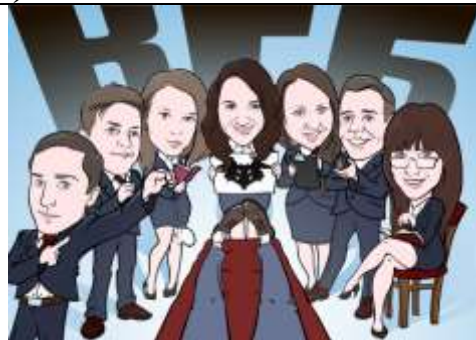
«КГБ: команда Гомельской богемы» – Гомельский государственный университет им.Ф.Скорины (социальные педагоги)