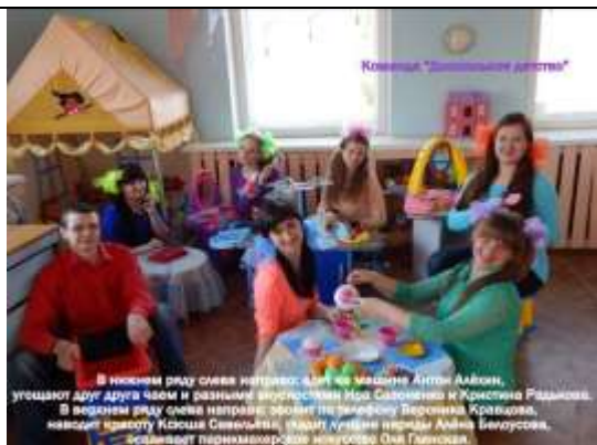
«Дошкольное детство» – Могилевский государственный университет им.А.А.Кулешова (воспитатели дошкольных учреждений)