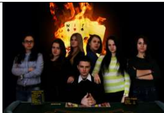
«UNIT» – Гомельский государственный университет (преподаватели иностранных языков)