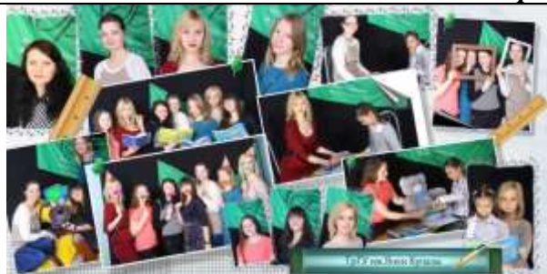
«Привет от дедушки Фрейда» – Гродненский государственный университет им.Я.Купалы (педагоги-дефектологи)