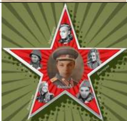
«Игра РАЗума» – Смоленский государственный университет (преподаватели иностранных языков)