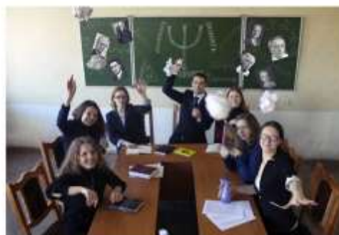
«Persona Ludus» – Белорусский государственный педагогический университет им. М.Танка