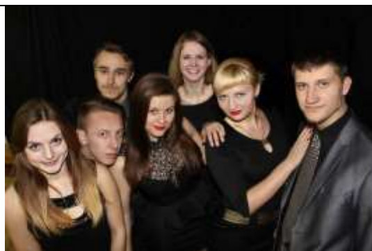
«7Я» – Белорусский государственный педагогический университет им.М.Танка (преподаватели физики, математики, истории, языков)