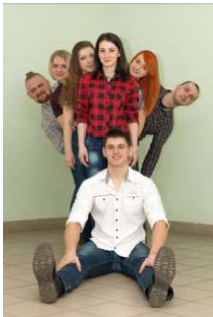
«Дивергенты» Белорусский национальный технический университет (преподаватели инженерных дисциплин)