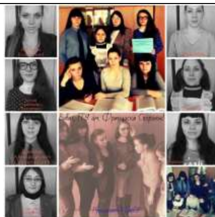
«Личность» – Барановичский государственный университет (воспитатели дошкольных учреждений, учителя начальных классов)