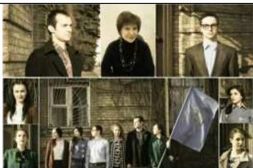
«Научно-исследовательский кружок неопедологии» – Гродненский государственный университет им.Я.Купалы