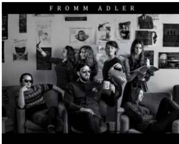
«Fromm Адлер» – Белорусский государственный университет