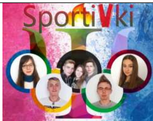
«SportiVki» – Гомельский государственный университет им.Ф.Скорины (спортивные психологи)