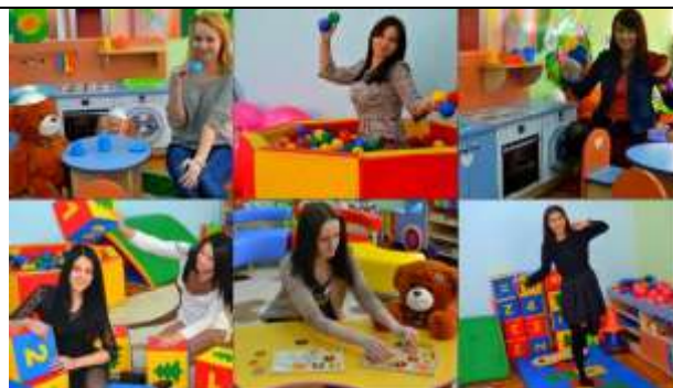
«Фромм может» – Полоцкий государственный университет