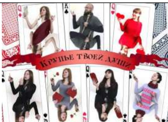
«Крупье твоей души» – Гомельский государственный университет им.Ф.Скорины (педагогические и социальные психологи)