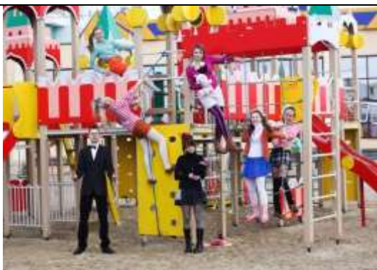
«ФИЛиН» – Гомельский государственный университет им.Ф.Скорины (филологи)