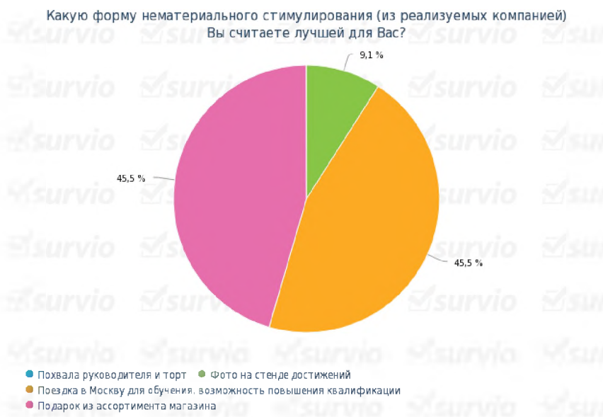
Рисунок 1. Удовлетворенность нематериальным стимулированием сотрудников

Подарок из ассортимента магазина (спортивные товары) воспринимается одинаково значимым для сотрудников, как и возможность развития и повышения квалификации.