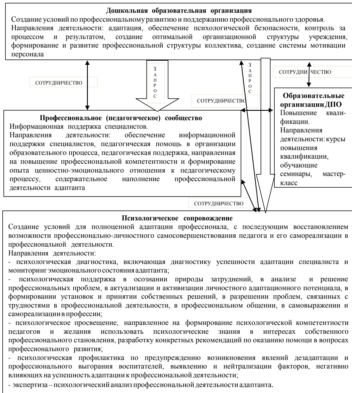
Рис. 1. Обобщенная модель многоуровневой системы сопровождения адаптации воспитателей к профессиональной деятельности

целесообразным создание обобщенной модели многоуровневой системы сопровождения адаптации воспитателей к профессиональной деятельности, в содержании которой учтены специфика и психологические условия профессиональной деятельности адаптанта (см. рис. 1).