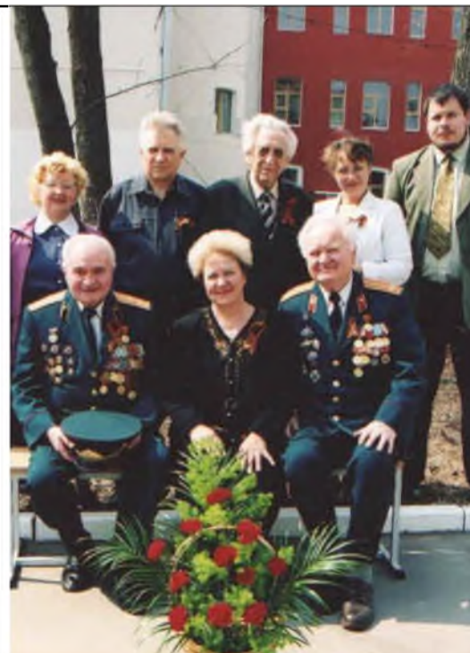
С коллегами ТвГУ

С 1958 по 1989 года служил и работал в Военной Академии им. Г.К. Жукова. Но он занимался не только научной военной деятельностью, он прекрасно проявлял педагогическое мастерство, в котором отразились все