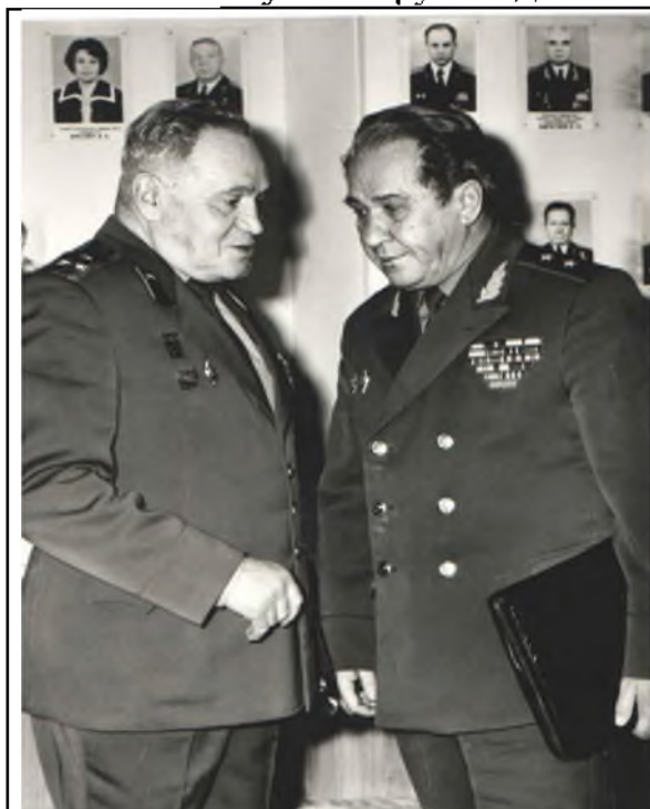
С коллегами по военному делу