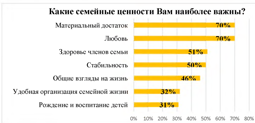
Рис. 3. Градация важности семейных ценностей респондентов

Конкурирующими семейными ценностями респондентов по результатам опроса стали «любовь» и «материальный достаток», при этом материальный достаток важен больше для женщин (80%), чем для мужчин (64%), любовь одинаково важна и для мужчин (70%) и женщин (68%), а «рождение и воспитание детей» важно лишь для малой части, почти одинаково как для мужчин, так и женщин – 31% (рис. 3).