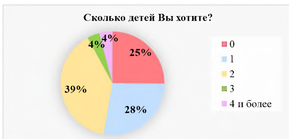
Рис. 5. Количество детей, которое хотят респонденты

Считаем важным сказать, что часть ответов, данных некоторыми респондентами, вызывают сомнения в их правдивости, особенно это касается ответов на вопрос о количестве желаемых детей, учитывая это, процент молодежи, желающей четверых и более детей, может быть ниже.