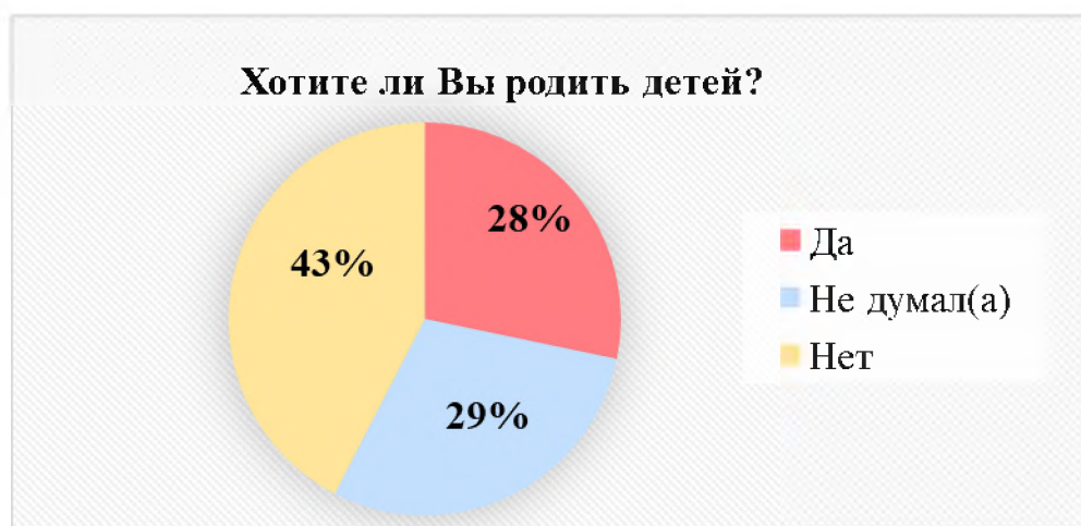
Рис. 1. Желание респондентов родить детей

Доля молодежи, не желающей рожать детей, оказалась самой большой – 43% (рис. 1). При этом женщин, не желающих рожать, (47%) больше, чем мужчин (40%). Так же можно обратить внимание что 29% респондентов не думали о возможности рождения детей.