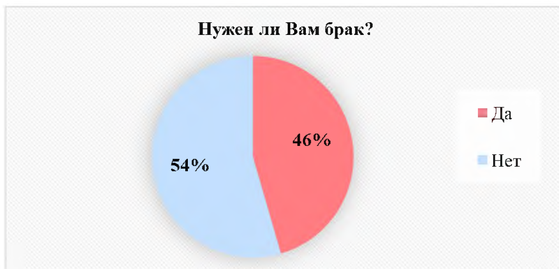
Рис. 8. Потребность респондентов в браке

Таким образом, было выявлено, что репродуктивные установки большей части молодежи направлены на отказ от рождения детей, при этом основной причиной, мешающей осуществить рождение ребенка, является «желание пожить для себя». Молодежь считает подходящей для себя формой семьи – малодетную. Многодетные семьи не популярны среди молодежи, процент молодежи, желающей 3, 4 и более детей, в нашем исследовании крайне мал и составляет 8% опрошенных. Возраст рождения детей молодежь откладывает на более поздний возраст – 24-30 лет, как и вступление в брак, который, как оказалось, не нужен большей части молодых людей. Семья для большей части молодежи это не про «рождение и воспитание детей», а про «любовь» и «материальный достаток».