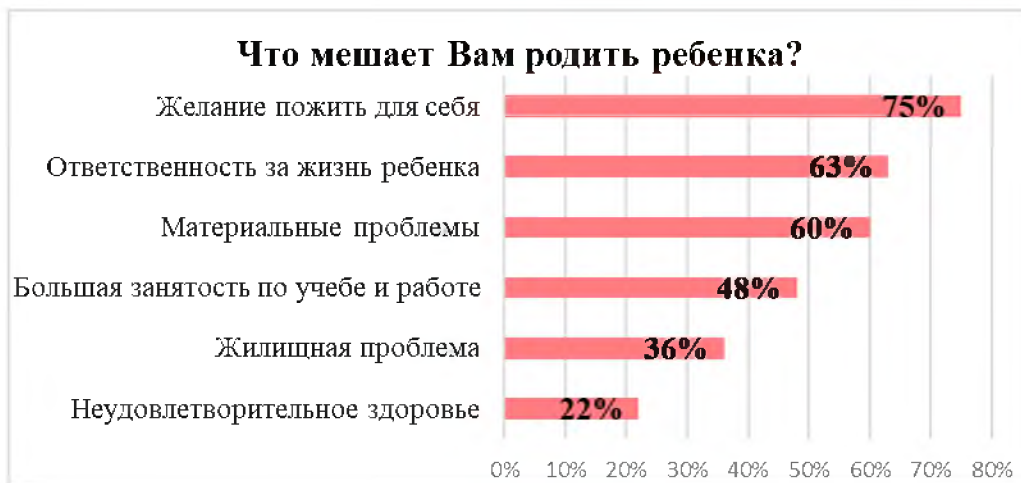
Рис. 2. Обстоятельства, препятствующие рождению детей по мнению респондентов

Конкурирующими семейными ценностями респондентов по результатам опроса стали «любовь» и «материальный достаток», при этом материальный достаток важен больше для женщин (80%), чем для мужчин (64%), любовь одинаково важна и для мужчин (70%) и женщин (68%), а «рождение и воспитание детей» важно лишь для малой части, почти одинаково как для мужчин, так и женщин – 31% (рис. 3).