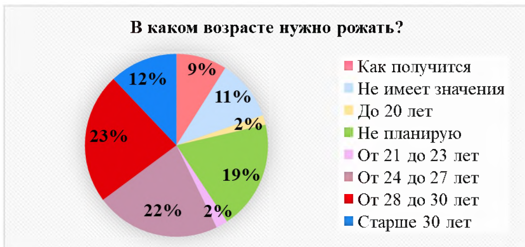
Рис. 6. Возраст рождения детей респондентами

Ответы о возрасте респондентов вступления в брак в среднем приходится на период 24-30 лет и составляет около 45% (рис. 7).